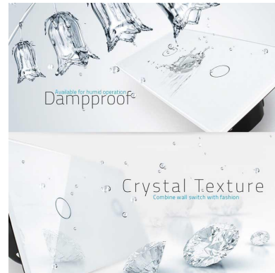
Crystal Texture Combine wall switch with fashion