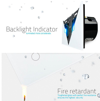
Fire retardant Tempered glass with perfect fire resistance ensures the highest security