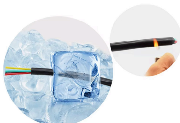
Silicone sheathed wire

Alta resistencia a temperaturas extremas -40° 160°