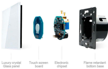
Luxury crystal Glass panel