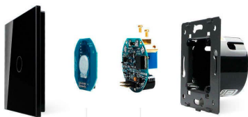
Luxury crystal Glass panel

Perceive the essence through the appearance