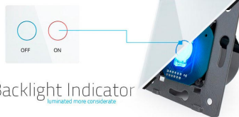
Backlight Indicator Illuminated more conveniently