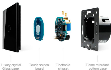
Luxury crystal Glass panel