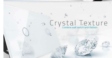
Crystal Texture Combine wall switch with fashion