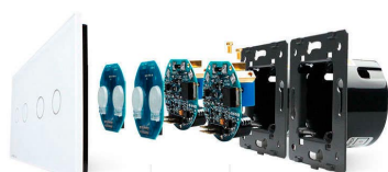
Luxury crystal Glass panel Touch screen board Electronic chipset Flame retardant bottom base

Perceive the essence through the appearance