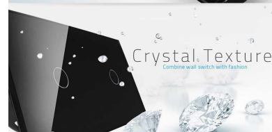
Crystal Texture Combine wall switch with fashion