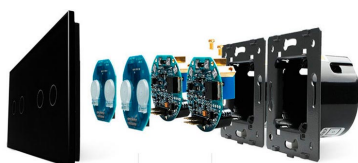
Luxury crystal Glass panel Touch screen board Electronic chipset Flame retardant bottom base

Perceive the essence through the appearance