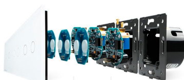
Luxury crystal Glass panel Touch screen board Electronic chipset Flame retardant bottom base