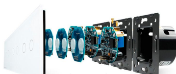
Luxury crystal Glass panel Touch screen board Electronic chipset Flame retardant bottom base