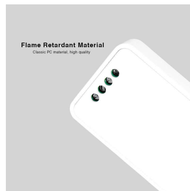
Flame Retardant Material Classic PC material, high quality