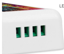
LED Strip Terminal