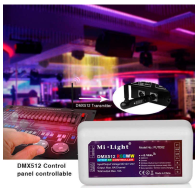
DMX512 Control panel controllable