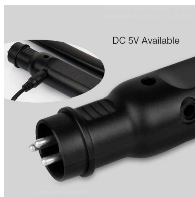
DC 5V Available